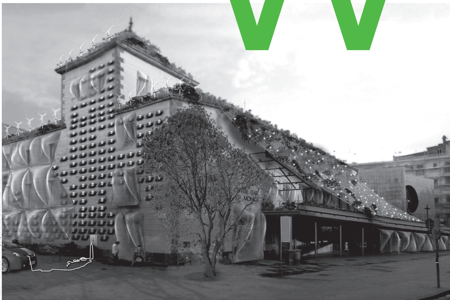
A Green New Deal - Un proyecto de Enric Ruiz-Geli