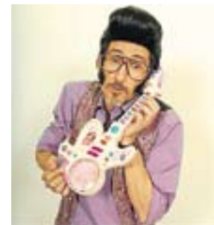
Rodolfo Chikilicuatre representará a España.

Ruiz-Geli es arquitecto por la ETSA de Barcelona y es director del estudio Cloud 9 desde 1997. Además de ser responsable de proyectos arquitectónicos tan impresionantes como Villa Bio, en Llers (Girona), compatibiliza el acuario de Nueva York con otros, como las viviendas 'alienígenas' Villa Nurbs (Empuriabrava) o el Centre de Cultura Joaquin Xirau (Figueras). Es escenógrafo y ha sido comisario del Pabellón de España en la V Bienal de Sao Paulo.